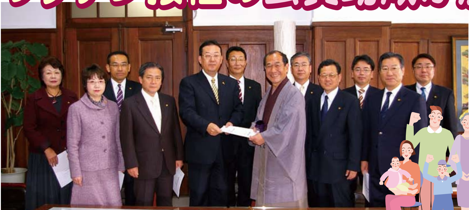
門川市長に平成23年度予算要望を提出(平成22年11月24日) 詳しくは2面を参照してください

昨年12月10日の京都市会本会議で、補正予算が可決成立。本年1月11日より、子宮頸がん予防ワクチン・ヒブワクチン・小児用肺炎球菌ワクチンの無料接種が始まっています。