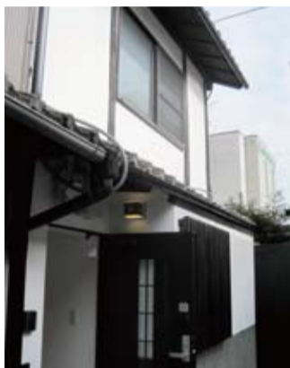
空き家流通促進事業によって生まれかわった京町家

住宅密集地が多い京都市での防災機能向上と地域福祉を重視し、空き家が危険家屋となることを未然に防ぐため、細街路でも住宅を再建築できる法整備と、適正管理を義務付ける条例制定を提案。