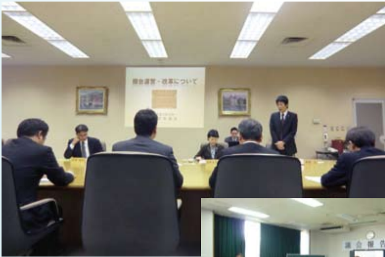
埼玉県所沢市で意見交換

また、23年11月に他都市の議会報告会(13日千葉県流山市・14日埼玉県所沢市)を視察した際には、地元の議員と意見交換しました。