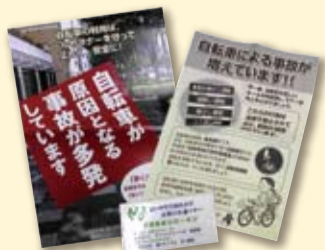
キャンペーン配布チラシ、ティッシュ