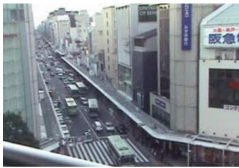
四条通の歩道の拡幅事業を推進