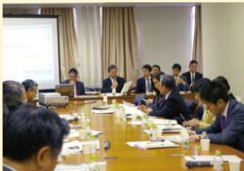
東京都江戸川区視察団受け入れ