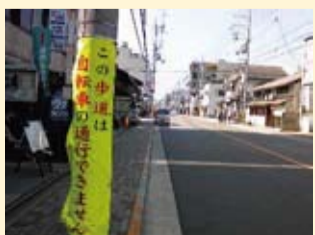
歩道通行禁止告知幕設置