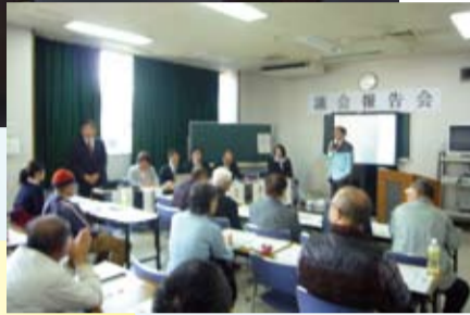
千葉県流山市議会報告会