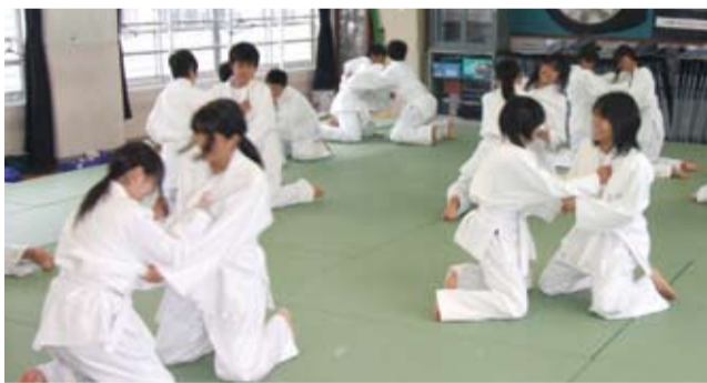
体育の授業で武道やダンスが必須に

ん」の検診制度を早期に実現すべきと訴えました。門川市長は市民の命と健康を守るため、前立腺がん検診制度の導入に向けて検討すると表明しました。