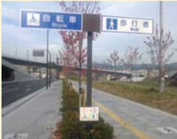
竹田街道の自転車道