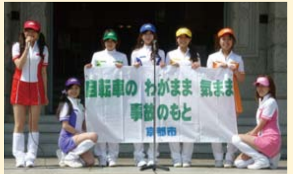
自転車マナー向上戦隊ほっとかナイス結成