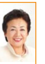
津田早苗議員 伏見区