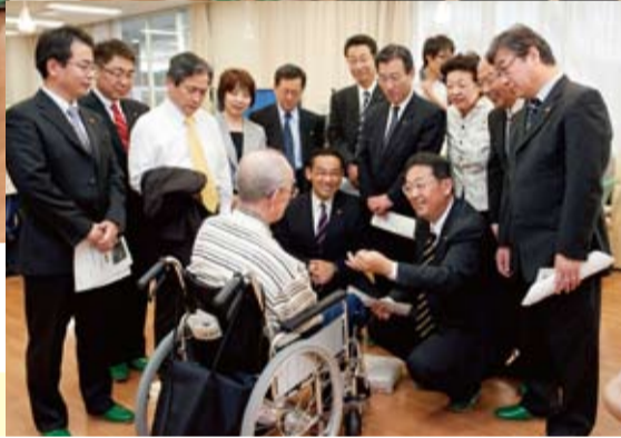
利用者のご意見を丁寧にうかがいました

人を超える公明議員が、課題が山積みの介護問題を改善するため、11月から12月にかけて「現場第一主義」で介護現場の実態を総点検する取り組みが始まりました。