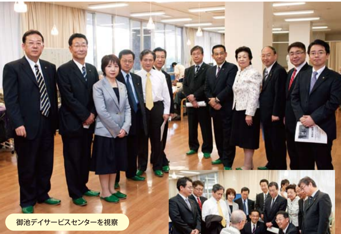
御池デイサービスセンターを視察

心機一転、山口那津男代表のもと新体制で船出した公明党は、「介護問題総点検アクションプログラム」を発表。全国3000