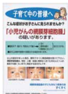
網膜芽細胞腫のポスター

やすく写真などで啓発していくべきと主張。副市長は京都市のホームページやはぐくみアプリに写真を掲載し、全てのはぐくみ室にポスターを掲示し、早期発見の啓発を図ると答弁しました。