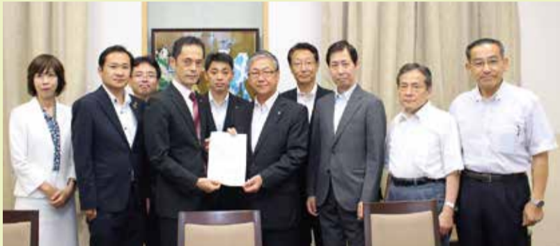
緊急要望書を提出