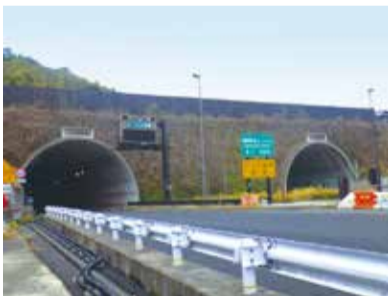
無料化となる稲荷山トンネル

平成31年4月より新十条通りの無料化に伴い、交通量が大きく増加することを見越し、山科区内の生活道路における渋滞対策