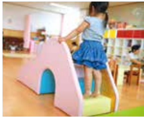
幼児教育無償化が実現へ

現を訴えてきた幼児教育の無償化が平成31年10月より本格実施されることから円滑実施に向けた推進体制等、今後の取り組み