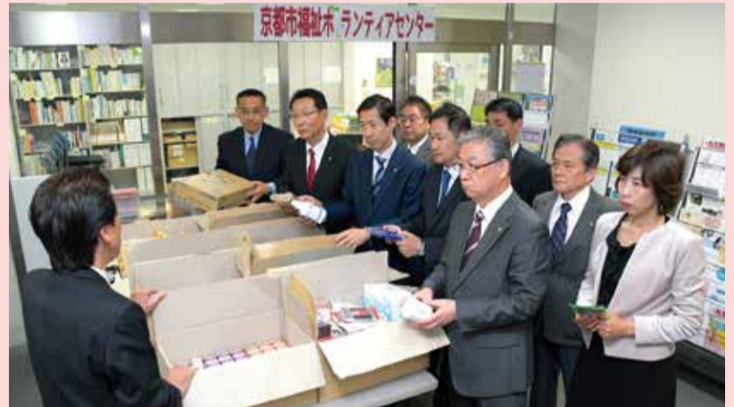
寄贈品の分配作業を視察